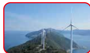
三崎ウインドパーク

国内17地点にて発電所の建設実績を持つ丸紅グループ。再生可能エネルギーにも注力し、全国各地で水力・太陽光・バイオマス・火力などの発電所を運営しています。