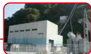
中小水力事業 三峰川発電所・蓼科発電所