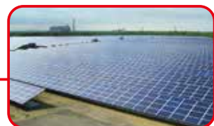
とまこまい 勇払メガソーラー